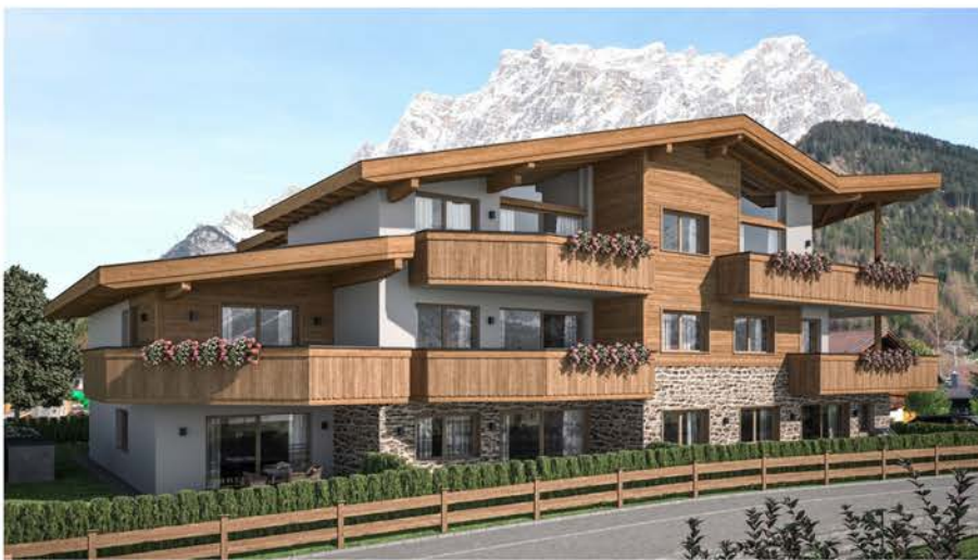
Visualisierung Vermartungs-Neubauprojekt Reinhard-Spielmann-Strasse, in Ehrwald